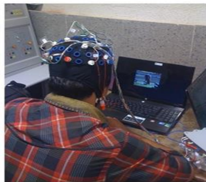
شکل ۲. تصویر یکی از نمونه‌ها در حال انجام تست و محل قرارگیری الکترودها