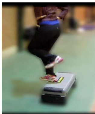
شکل ۳. پرش تک پا رو به عقب

ثانیه استراحت، با در نظر گرفتن مدت زمان هر فعالیت، میزان استراحت متناسب با آن برای هر فرد اعمال می‌شد. شکل‌های ۱ تا ۳، به ترتیب پرش تک پا از پهلو، روبه‌رو و رو