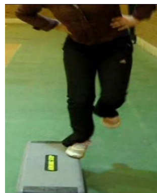
شکل ۱. پرش تک پا از پهلو