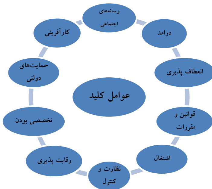
شکل ۲. عوامل کلیدی توسعه باشگاه‌های ورزشی - خصوصی

هرکدام از وضعیت‌های پیش‌روی عوامل کلیدی توسعه باشگاه‌های ورزشی خصوصی مشخص می‌شود. سپس با در نظر گرفتن میانگین ساده از آن‌ها، داده‌ها برای ورود به نرم‌افزار سناریو ویزارد آماده می‌گردند. نرم‌افزار سناریو ویزارد به‌طور کلی ۳ دسته سناریو را برای محقق ارائه می‌دهد: سناریوهای با احتمال قوی، سناریوهای ضعیف و سناریوهای باورکردنی. با توجه به وسعت ماتریس و ابعاد آن و بر اساس نظرات کارشناسان در نرم‌افزار سناریو ویزارد، سناریوهای به‌دست‌آمده برای تحقیق حاضر شامل: ۶ سناریوی قوی؛ ۳۰ سناریوی باورکردنی؛ ۶۲۳ سناریو با سازگاری ضعیف بوده است. از آن‌جا سناریوهای قوی دارای ضرایب غیرقابل‌اعتماد بوده و سناریوهای ضعیف دارای حجم بالای از حالات می‌باشند، منطقی است سناریوهای باورکردنی که دارای سطح بالای از سازگاری هستند مورد تحلیل قرار گیرد.