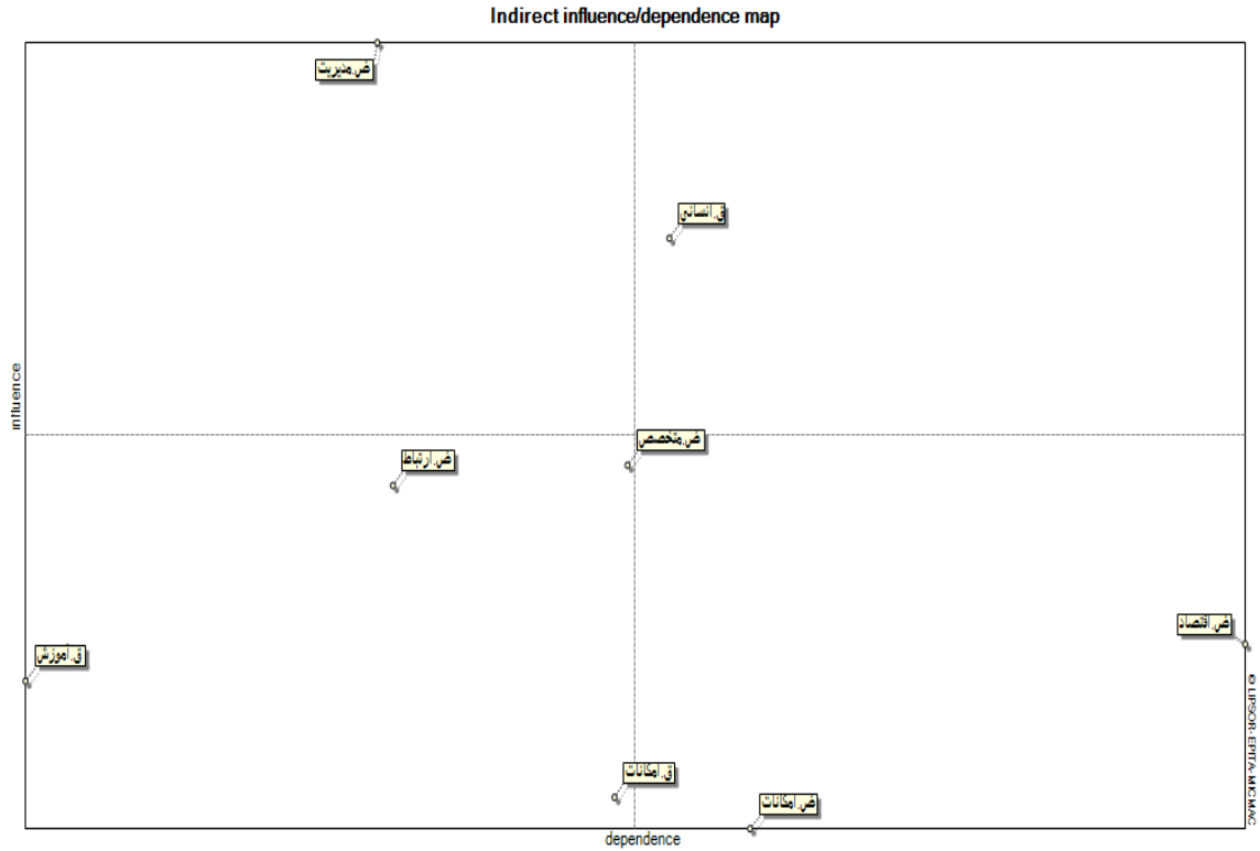
شکل ۱. پلان تأثیرگذاری و تأثیرپذیری سیستم

همان طور که ملاحظه می‌شود، بیشترین میزان تأثیرگذاری مربوط به مؤلفه ضعف سیستم مدیریت است و بیشترین میزان تأثیرپذیری نیز مربوط به ضعف اقتصاد ورزش می‌باشد.